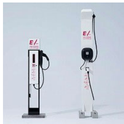
モデル1 モデル2 200V/6kW出力/倍速充電/4G通信