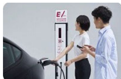
ドライバーへの認知活動・集客支援実施