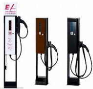
モデル1は茶、黒の変更も可能 (別料金)