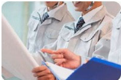
施設の電気工事に応じた工事内容の 決定、工事実施