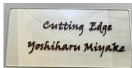
木板、プラスチック板