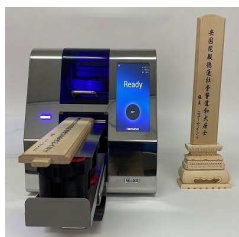
お寺や霊園の卒塔婆