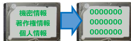
消去前 (イメージ) 消去後