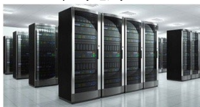
データ破壊サービス会社