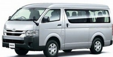
オンサイト出張破壊サービス