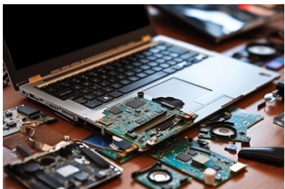
オンサイト出張破壊サービス