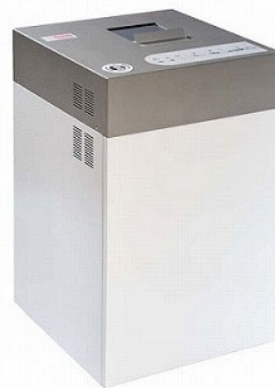
Proton PDS-88 100V / 60Hz