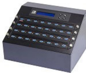
USB3.2デュプリケーター

USB接続タイプの外付けHDD、MP3プレイヤー、USB2.0/3.0/3.1のデバイス、eUSB、USB-DOMIに対応