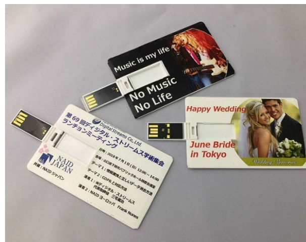
右上:Gシリーズで外付HDDのコピーが可能 右下:Gシリーズで名刺型コピーガードUSBの製作が可能